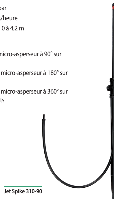
Jet Spike 310-90