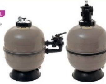
ProSeries™ HI Side