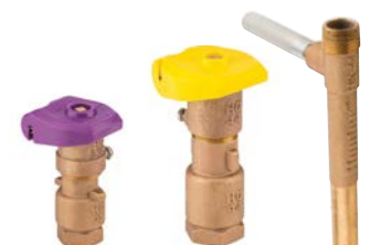
HQ-33-DLRC-R HQ-44-LRC HK-44