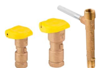
HQ-3-RC HQ-5-RC HK-33

HQ-5-LRC-BSP = HQ-5-Ventil mit Gummiverschlusskappe und BSP-Gewinde